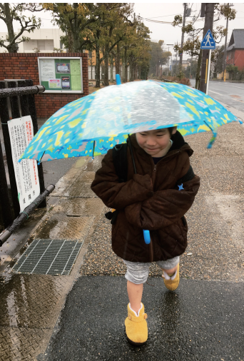
雨にも負けずお出かけです

平日の放課後では事務所での過ごしが増えます。一番、気軽に過ごすことができるスポットです。「今日は寒いし、事務所ですiPadするわ」と言われる方もおられます。当法人は利用者の方