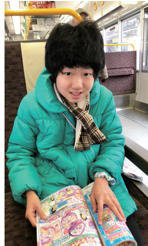
電車でのお出かけでは暖がとれますね

かけられる時もあり、嬉しく思います。地域の中で育まれながら活動することができて、いることを嬉しく思います。雨や雪の日にも外出支援をさせていただきます。季節や天氣に合わせて過ごしやすいように配慮するのがガイドヘルパーの役割ではないかと思ひます。思い出に残る日を一緒に創っていきましょう、寒さに負けず励みたいと思います。 (中野)